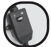
Interruptor protector de descargas eléctricas