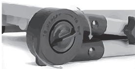
Fijación de ángulo 180°

Entrada: 220 - 240VAC ~ 50Hz Potencia: 50W. IP65. Luz día: 6500K. Lumens: 4.700Lm. 30.000 horas de vida. Color: Negro. Ángulo apertura: 110°. Cable: 1.5m de H05RN-F 3G 1mm.