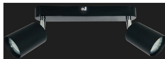
Foco 82.306/N (Negro cromado)